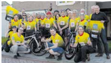
Teamfoto Toons Toppers 2026

De Toons Toppers van het Toon Hermans Huis Weert e.o. zijn weer begonnen aan hun bijzondere uitdaging: de beklimming van de Mont Ventoux op 3 en 4 september, georganiseerd door Stichting Groot Verzet tegen Kanker. Met een team van 19 deelnemers, 7 fietsers en 12 wandelaars, zetten zij zich de komende maanden in voor een intensieve voorbereiding, met één gezamenlijk doel: het bereiken van de top van de "kale berg".