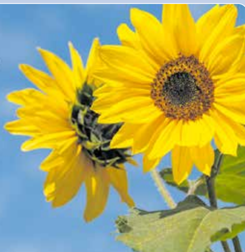
Samen zorgen we voor gele pracht in Nederweert.