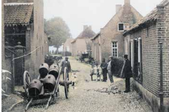
Biervaten staan klaar bij brouwerij De Pelikaan. Foto van omstreeks 1905. Collectie SGN. Kunstmatig gekleurd.

Wie het onlangs verschenen krachtige boek 'Haole klot' heeft gelezen (en dat zijn er velen in Nederweert) die kan vermoeden welke enorme hoeveelheid bier er heeft gestroomd in de tientallen etablissementen die de horeca van Nederweert zo'n 40 jaar geleden nog telde. De grote brouwerijconcerns met de bekende naam voeren er wel bij. Veel vroeger was bier nog een lokaal product, afkomstig van eigen brouwerijen.