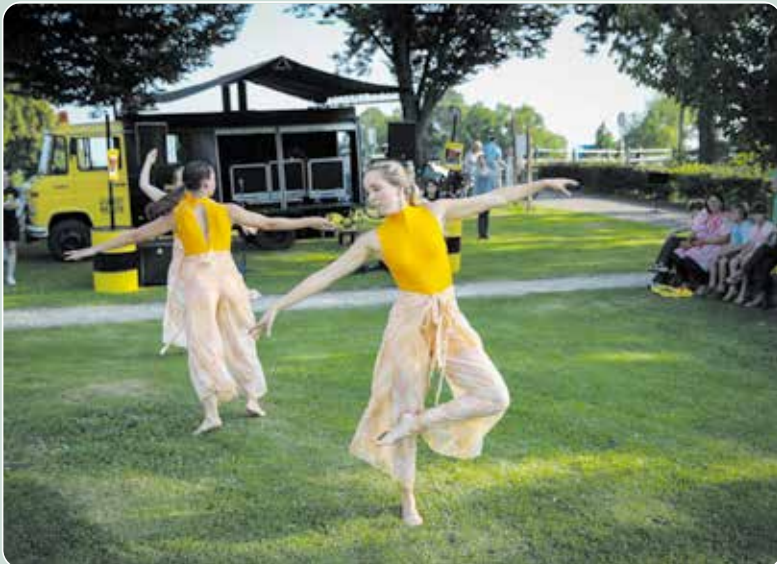
Ook dit jaar is er weer een gevarieerd programma samengesteld voor het Cultuurfestival.