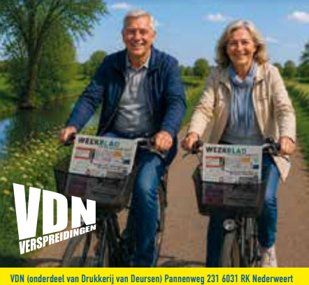
VDN (onderdeel van Drukkerij van Deursen) Pannenweg 231 6031 RK Nederweert