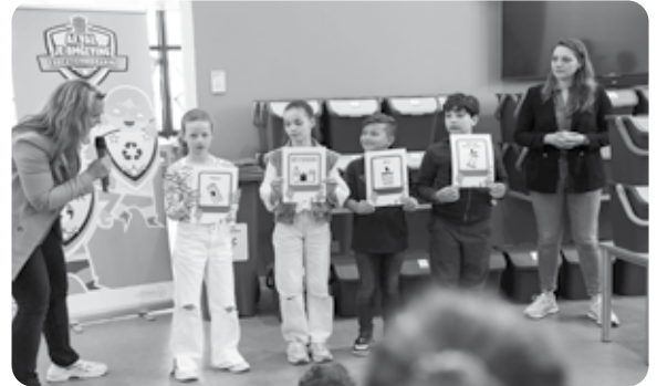
Leerlingen van basisschool De Schrank krijgen een gastles en spelen de afvalquiz, begeleid door beide Irvissen van adviesbureau De Bries.