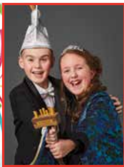
PRINS GOOF I PRINSES LANA

VASTELAOVENDSBIJLAGE VAN HET WEEKBLAD VOOR NEDERWEERT 2023