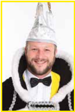
PRINS BAS II

"Kukes en kui-j komtj vanna stal, Ut es weer tiedë vör schoeëne zeiver en lompe kal"