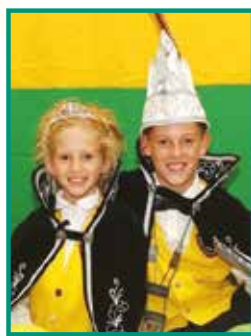
PRINS SIEM I PRINSES FAY

"Hosse..... danse..... kaake, met dees daag gaon vae ut maake !!!!"