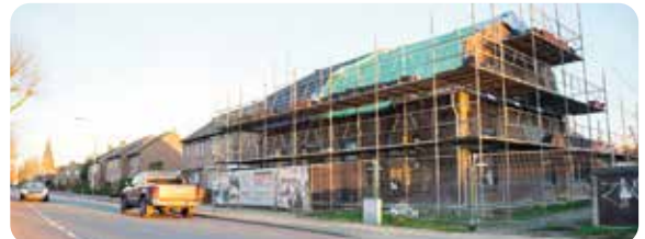
Van deze woning aan de Onze Lieve Vrouwestraat worden twee halfvrijstaande woningen gemaakt.

In de voorbereiding van het ontwerpbestemmingsplan hebben de initiatiefnemer en de architect het bouwplan meerdere keren gepresenteerd aan de belangstellenden uit de omgeving. Deze omgevingsdialoog heeft geleid tot een aanpassing van het oorspronkelijke plan. Het college is blij met deze ontwikkeling voor Ospel.