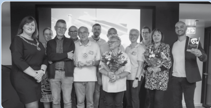
De ontvangers van de Gemeentecomplimenten 2023 samen met burgemeester Op de Laak.