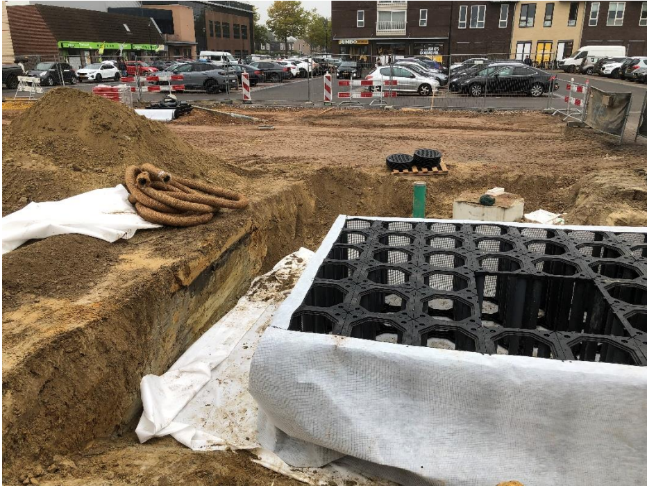
Burg. Hobusstraat, aanleg infiltratiebassins (locatie 7). Links in de zijwand van de kuil is de doorsnede van de middeleeuwse dorpsgracht zichtbaar. Alle foto's ingezonden door verontruste inwoners.