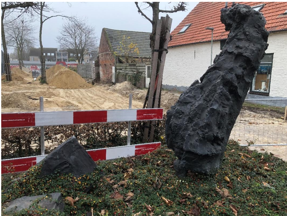
Burg. Hobusstraat vanaf Kerkstraat (locaties 1, 4 en 5). Overzicht graafwerkzaamheden.