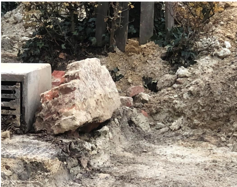
Burg. Hobusstraat. Gesloopte en verwijderde muurresten van fundering voormalige Dubbele Kapelaniegebouw.