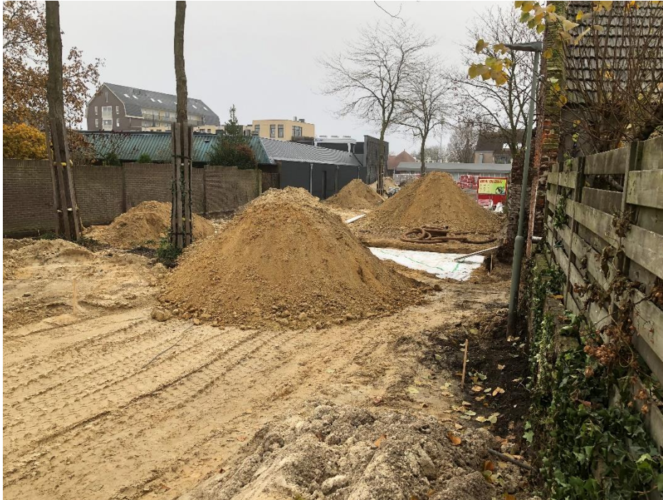
Burg. Hobusstraat, aanleg infiltratiebassin op de plek van laatmiddeleeuwse bebouwing en voormalige Dubbele Kapelaniegebouw.