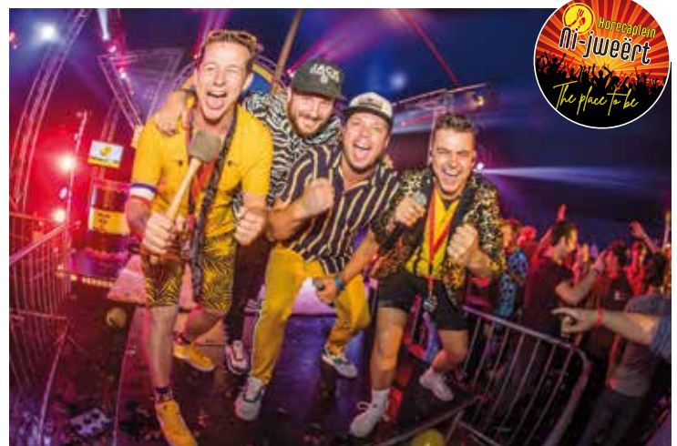
Feestband Effe Serious zal op vrijdag de aftrap nemen voor Nederweert kermis 2022

Zaterdag 27 augustus Het feest op het horecapplein gaat op zaterdagavond om 21.00 uur gewoon verder met de top band UNITE. Met passie en vol energie brengt UNITE originele mixes, de fijnste hits, de hardste beats en de beste feestnummers van nu, classics of Nederlands-