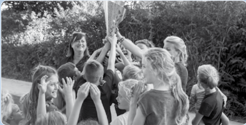
Welke straat wordt het dit jaar en gaat er met de trofee van door?