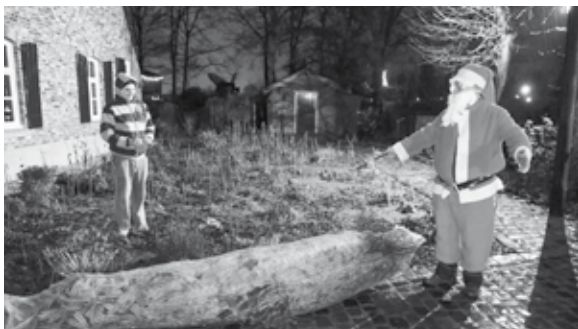
Vorig jaar kwam de kerstman zelf langs om de bomen te bezorgen.

Meldt u zich aan voor een gezellige buurtactiviteit? Dan zorgen wij voor een mooie buurtboom!