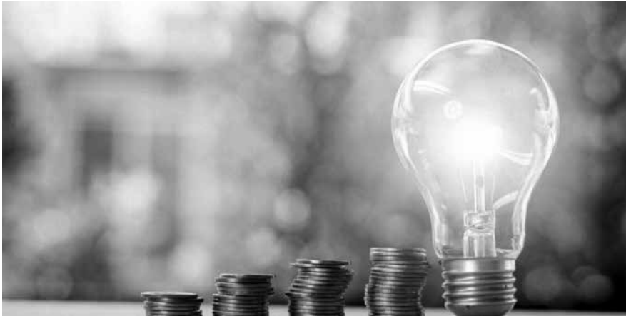
U kunt als MKB-ondernemer financiële steun krijgen bij uw plannen voor verduurzaming. Ondernemersregio Keyport werkt hiervoor samen met energiekees.nl.