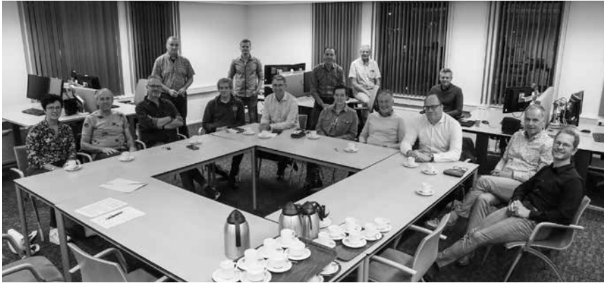
Vertegenwoordigers van de betrokken partijen waren aanwezig om de intentieverklaring te ondertekenen.