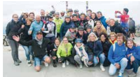
Groepsfoto van Toons Toppers 2021 met begeleiders op de top van de Mont Ventoux

Vijftientig Toons Toppers van het Toon Hermans Huis Weert hebben op 2 en 3 september wandelend en fietsend de Mont Ventoux in Frankrijk bedwongen. Zij zamelden daarmee geld in voor kankeronderzoek en voor het Toon Hermans Huis.