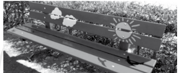
Weer eens wat anders: zitten op de lucht. Laat je creativiteit de vrije loop bij het pimpen van een bankje.

Onder de noemer 'Nederweert fleur op' zijn we voor de zomer een nieuwe buitenactie gestart: 'Fleur op je bankje!' We roepen straten en buurten op om een bank of picknicktafel in de eigen omgeving te 'adopter' en deze naar eigen wens te pimpen. Uiteraard mag iedereen meedoen en er is ook nog een leuke prijs te winnen.