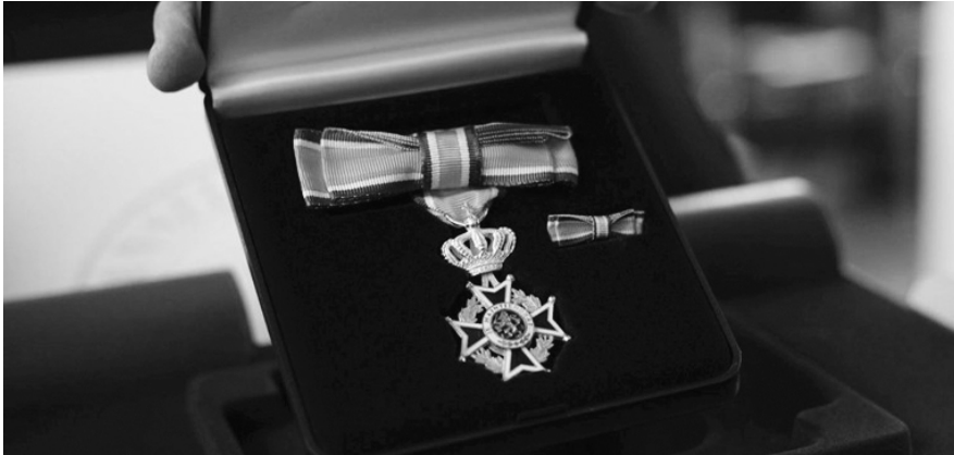
Er is een lange voorbereidingstijd nodig voor het aanvragen van een Koninklijke onderscheiding. Begin dus op tijd met de procedure.