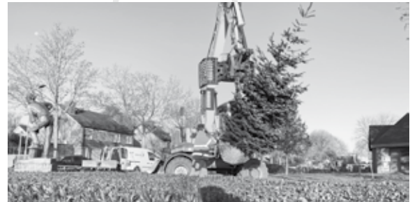
De boom krijgt z'n vaste plek op het grasveldje.

Dit jaar is de kerstboom wel erg vroeg gezet in Nederweert. Ruim een maand eerder dan de afgelopen jaren.