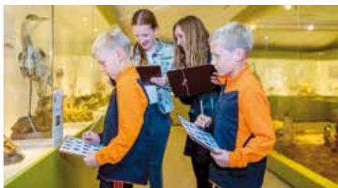
Vakantieactiviteit in Museum Klok & Peel

Bij de uitreiking van het keurmerk 'Kidsproof museum' en de 'Museuminspector van het jaar', gehouden op maandag 16 november jl. middels een internet livestream, heeft Museum Klok & Peel opnieuw dit prestigieuze certificaat ontvangen. In Nederland mogen 52 musea zich 'Kidsproof' noemen. Het keurmerk wordt bepaald door kinderen en uitgereikt door de Museumvereniging.