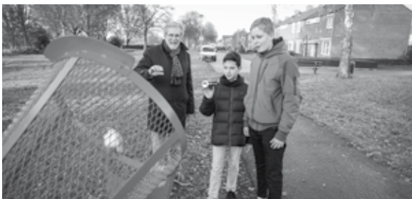
In december vorig jaar namen twee leerlingen van het Citaverde College samen met wethouder Voss de nieuwe blikvangers in gebruik.

"Het afgelopen jaar zagen we de hoeveelheid zwerfafval en dumpingen toenemen", gaat Van de Kerkhof verder. Corona speelde daar een rol in. Gelukkig zijn er ook mensen die de openbare ruimte wel respecteren. Zo hebben we een aantal vrijwilligers, zogenaamde ZAPPers, die regelmatig zwerfafval prikken. Wilt u, los van het nieuwe afvalbeleid dat in de maak is, ook in actie komen tegen zwerfafval? Neem dan contact op met teamschoon@debries.eu.