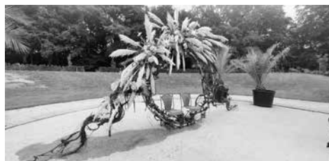
Werk van Ilse Rambags

Zes bloemstijlen hebben de herfst en al wat daar bij hoort als uitgangspunt genomen voor de expositie 'Kunstzinnig Natuurlijk'. De creativiteit van de deelnemende bloemstijlen overstijgt het gebruikelijke 'schikwerk' en kan zich met waarheidige scharen onder het kunstzinnige, met ieder een eigen stijl en aanpak. Variërend van gestreken bloemen en bladeren, tot en met ultra driedimensionaal werk.