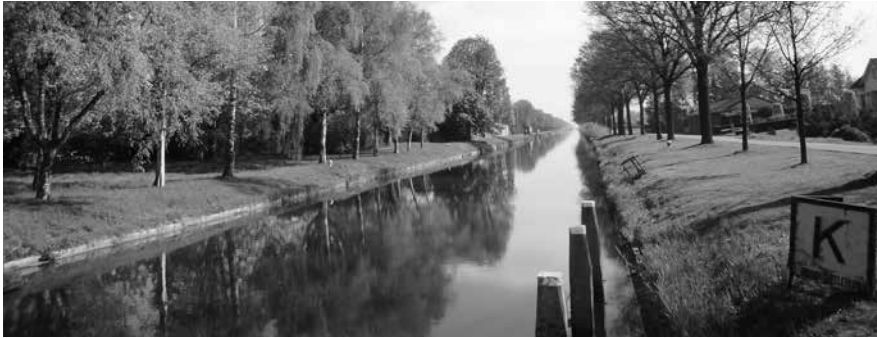
De route volgt het Grand Canal du Nord. Ook het Noordvaartkanaal maakt hier deel van uit.