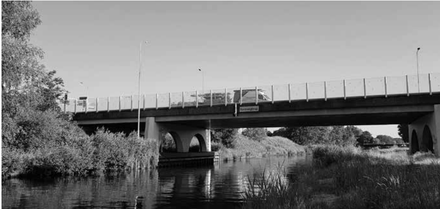
Een nieuwe fietsbrug langs de Randwegbrug over de Zuid-Willemsvaart of een fietstunnel onder de N275 die Staat met de Rijksweg Zuid verbindt. Samen met stakeholders zetten we de komende tijd de voor- en nadelen van beide mogelijkheden op een rij.