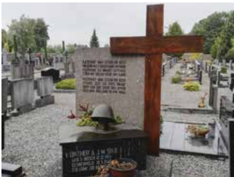
Soldatengraf te Neer

Ter gelegenheid van de 75 jarige bevrijding van Limburg is in de gemeente Leudal onlangs de bijzondere fietskaart 'Leudal e.o. 40-45' van de pers gerold. Deze fietskaart voert langs 37 bekende en onbekende herinneringsplekken aan de Tweede Wereldoorlog in de gemeente Leudal en omringend gebied. In 3 routes, die variëren in lengte van 31 tot 45 km en die zijn gekoppeld aan het bekende fietsknoppuntennetwerk, ervaart de fietser dat de gemeente Leudal niet in één keer, maar in feite in twee fasen door de geallieerden is bevrijd. De routes op de kaart zijn vernoemd naar de verschillende frontgebieden die tijdens de bevrijdingsacties in en rondom Leudal hebben gelopen.