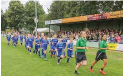
Steerfoto van afsluitende vrijdagmiddag

Na zo lang als mogelijk gewacht te hebben, heeft Eindse Boys moeten besluiten de 20e VSN voetbaldagen van 13 t/m 17 juni te annuleren. Na overleg tussen bestuur, VSN, de projectgroep en het advies van het crisisteam van de gemeente, wilde men het risico niet nemen.