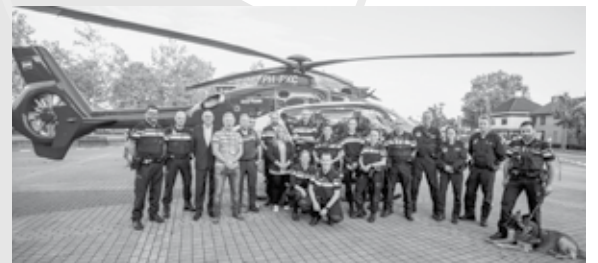
Een spectaculair onderdeel van de oefening was de inzet van de politiehelikopter.

De landing van de politiehelikopter op het Raadhuisplein trok veel bekijks voorige week donderdag. Logisch met zo'n niet alledaags tafereel. De reden was een grote Burgernet-oefening in onze gemeente.