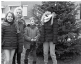
In 2017 was er ook veel plezier met de buurtkerstboom in de Emmastraat.

Elkaar ontmoeten Het project is bedoeld om straten en buurten in de donkere wintermaanden te stimuleren om elkaar te ontmoeten door gezellig samen iets te organiseren.