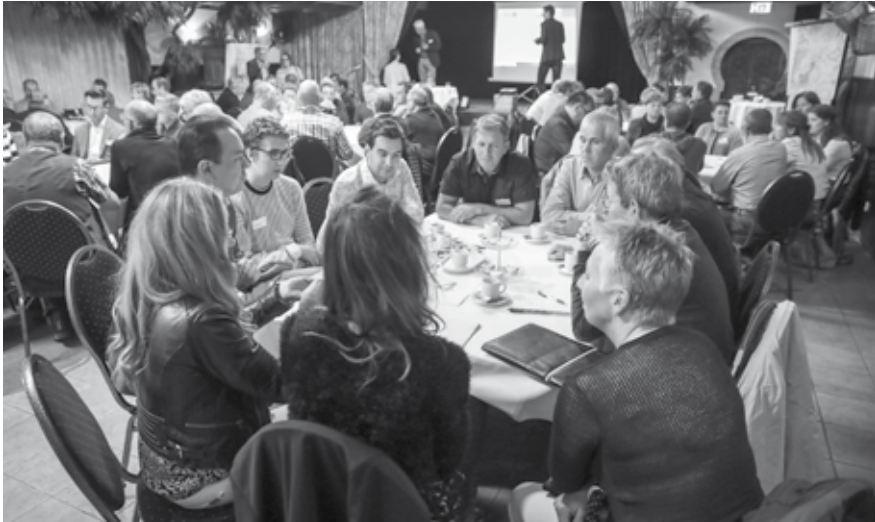
Er zijn veel ontwikkelingen in het buitengebied, de Omgevingswet komt eraan. Tijd voor een Omgevingsvisie die we samen met u opstellen. Begin oktober was er al een meedenksessie voor belangstellenden.