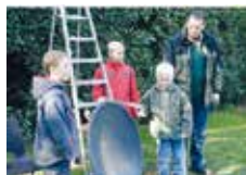
Foto van de Jota/Joti uit 2003

Tegenwoordig zenden we nog steeds, maar er worden ook via internet leuke contacten gelegd. De start is vrijdagavond met het expedite Joti spel. Met drie teams van de oudere speltakken wordt er per trein door heel Limburg naar opdrachten gezocht, die drie andere teams op Scoutencentrum de Boelenbeem moeten zien oplossen. Altijd heel leuk, heel spannend en heel fanatiek. Op zaterdag overdag en 's avonds zijn de jongere speltakken actief met allerlei opdrachten. Zij zijn dan te gast bij Scouting St. Job op Leuken. Vanwege het 65 jarig bestaan van Scouting Nederweert, een aantal foto van de Jota/Joti uit ons archief. Wil je meer informatie over Scouting Nederweert ga dan naar onze website. www.scoutingnederweert.nl