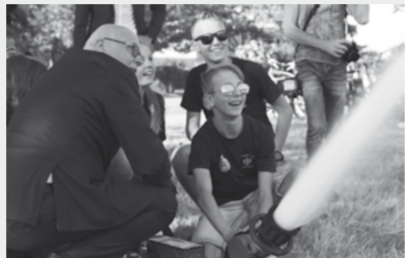
Jonge brandweermannen in spe hielpen burgemeester Evers bij de inwijding van de waterwagen en het terrein.

's Avonds mocht de burgemeester (als hoofd openbare orde en veiligheid) de nieuwe waterwagen van de brandweer Nederweert officieel inwijden. Dat deed hij samen met afvaardigingen van het gemeentebestuur en van de Veiligheidsregio, de postcommandant van Nederweert en het personeel van de brandweerpост Nederweert. Enkele jonge brandweermannen in spe hielpen de burgemeester daarbij. Ook werd het perceel meteen symbolisch ingewijd.