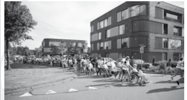
Genieten van een mooie tocht door Nederweert.

Al een aantal jaar 'loopt Nederweert op rolletjes'. Voor inwoners in een (elektrische) rolstoel of scootmobiel is er op woensdag 13 juni weer een rolstoeltocht. De organisatie doet er alles aan om er opnieuw een mooie avond van te maken!