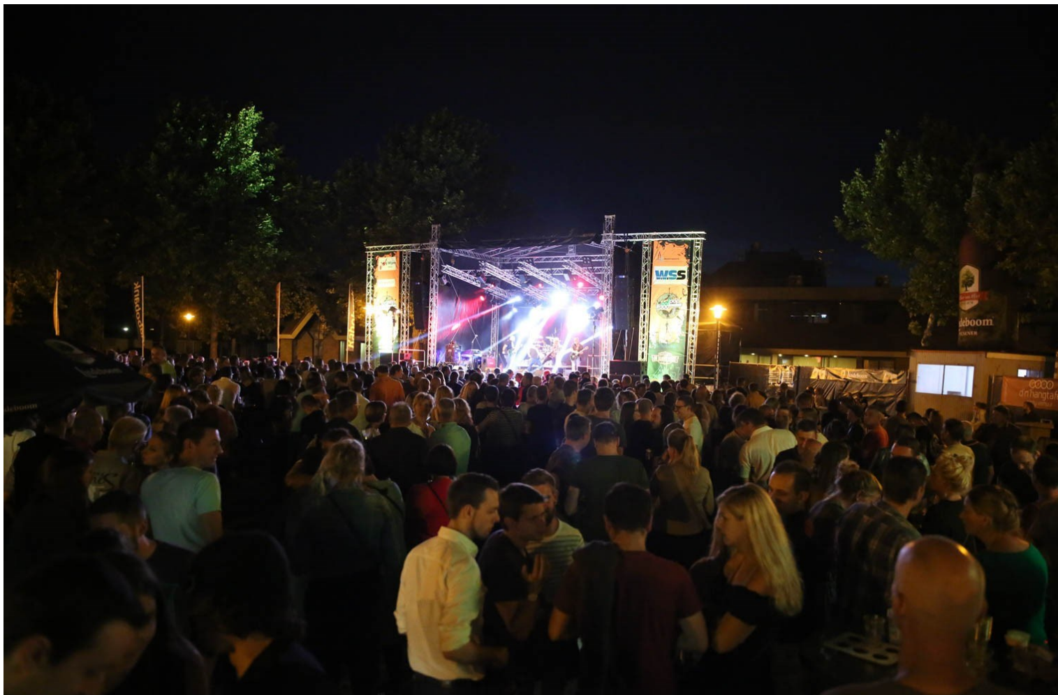
Raadpop 2017