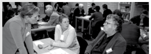
Deelnemers deden enthousiast mee in de workshops over succesvol samenwerken.

In Sportcentrum De Bengelêe vond op donderdagavond 8 maart een bestuurdersontmoeting plaats met als thema: Succesvol (samen)werken voor clubbestuurders. De organisatie was in handen van het NOC*NSF, Huis voor de Sport Limburg en de gemeente Nederweert. Maar liefst 125 aanmeldingen uit heel Limburg konden we registreren. Uit onze gemeente waren veertien organisaties aanwezig.