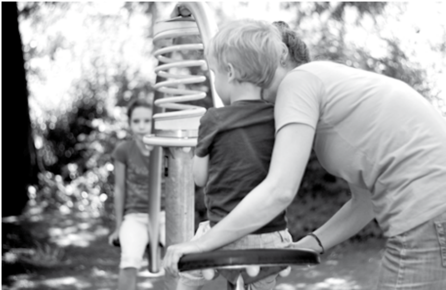
Het Centrum voor Jeugd en Gezin heeft een spilfunctie gekregen in de jeugdhulpverlening.