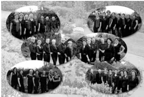
m.m.v. bekende koren uit de regio.