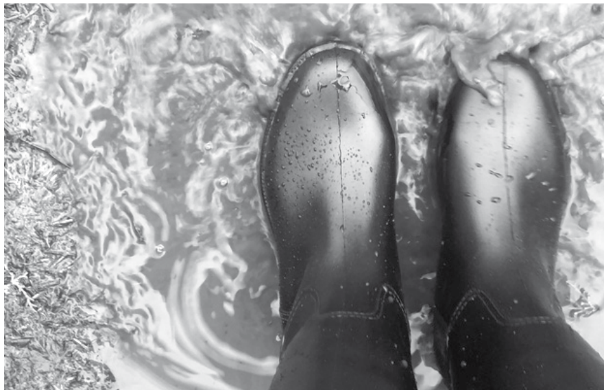
Samen kunnen we iets doen aan de overlast van water.