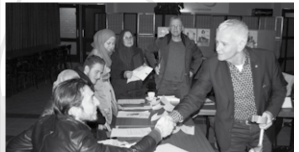
Wethouder Geraats feliciteert een statushouder na afloop van de ondertekening van de participatieverklaring.

Twaalf statushouders volgden afgelopen vrijdag een workshop in het gemeentehuis waarin ze kennismaakten met de kernwaarden van onze samenleving. Daarna tekenden ze in het bijzijn van wethouder Geraats de participatieverklaring.