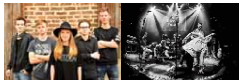
Stageflight, Popsport 2017)