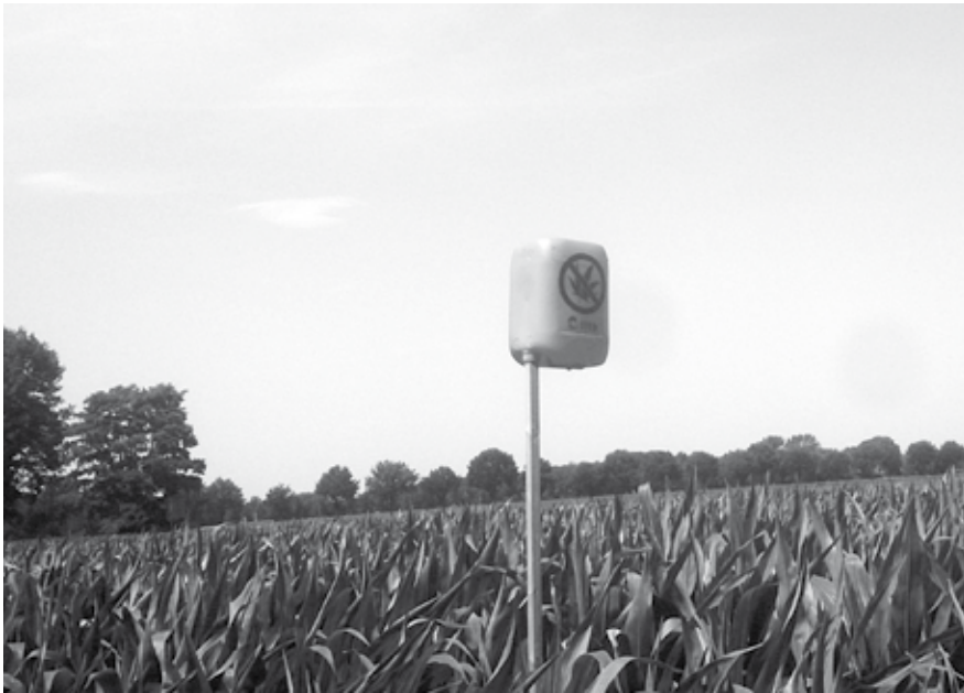
Als preventief signaal plaatsen deelnemende ondernemers oranje jerrycans op hun land: een bakken dat zowel vanaf het terrein als vanuit de lucht goed zichtbaar is tijdens controle door de politie.