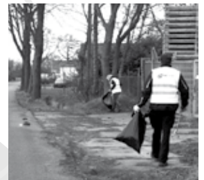
Enthousiaste vrijwilligers aan het werk in 2015.