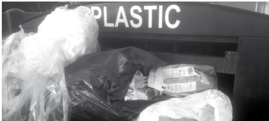
De capaciteit aan afvalcontainers wordt uitgebreid en dat is ook nodig.