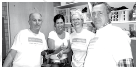
Betrokken inwoners vormen een belangrijk onderdeel van een samenleving.

Op dinsdag 8 september 2015 vindt de kick-off plaats voor een co-creatie traject in de kern Nederweert. Het is de volgende stap in de kernaanpak waarbij u aan de toekomst werkt van de kern Nederweert.