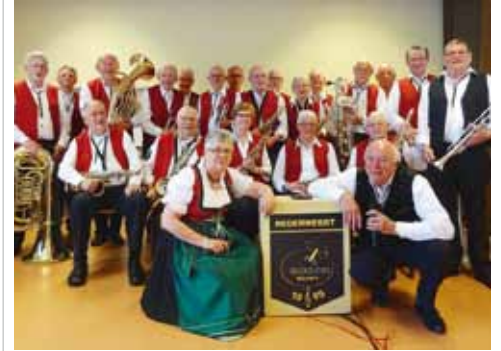
De coconblazers, op 30 juli in Weert en 2 augustus bij de Pelen

gezongen nummers van Ernst Mosch en andere bekende componisten. Als het weer meezit wordt het dus weer een gezellig avondje. Op zondag 2 augustus speelt de kapel op het Streekfestival bij het buitencentrum van de Pelen in Ospel Het Orkest staat onder leiding van Had Geurtjens die alweer een tiental jaren op de bok staat en ook zelf zijn partijtje reglementaire blaasmuziek, ook populaire