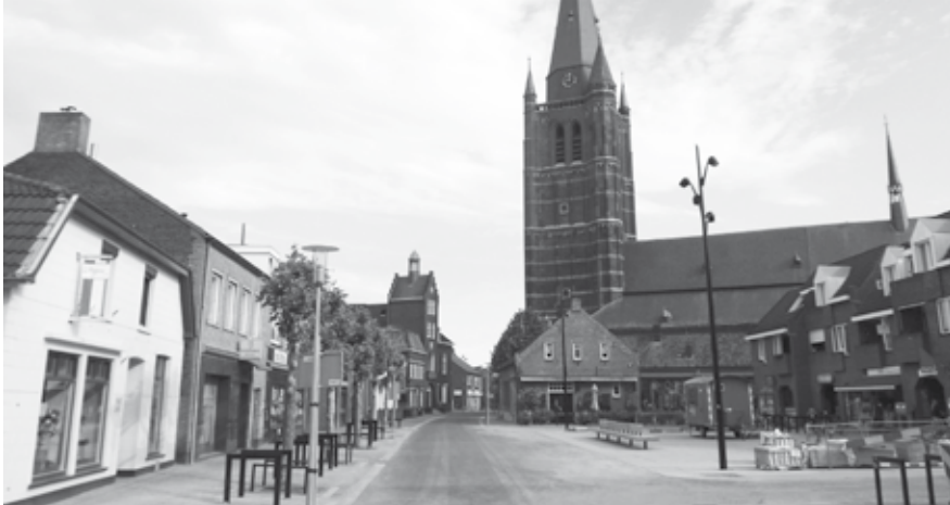
De herinrichting van de Kerkstraat was vorig jaar een groot project in het centrum. Nu wordt er gewerkt aan het opstellen van een detailhandelsvisie.