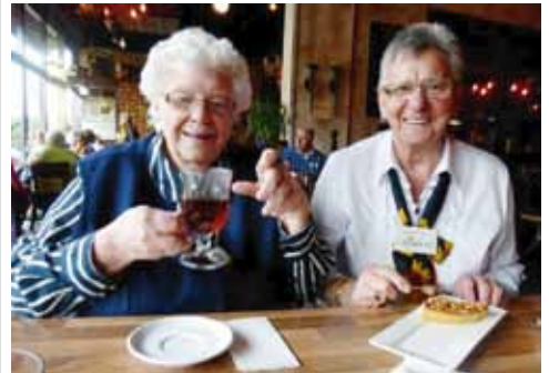
Genieten in Etten-Leur

Afgelopen woensdag 18 maart, heeft de Zonnebloem afdeling Nederweert weer een gezamenlijke activiteit georganiseerd. Op het programma stond een dag winkelen in het winkelcentrum van Etten-Leur. Bij vertrek aan De Pinnenhof leek het erop dat de lente weer was geïmagineerd. Echter in Etten-Leur werden we toch onaangenaam verrast met een koude snijdwind. Gelukkig was het winkelcentrum overdekt en konden, vooral de dames, naar hartenlust maken met de nieuwste mode. Tevens was het mogelijk om het Heemkundig Streekmuseum Jan van Houte. Anno 1964 te bezoeken. Hiervan hebben de nodige gasten gebruik gemaakt. De naam van het museum is ontleend aan Jan van Houte, de vroegere bezitter van het kasteel in Etten-Leur dat in de dertiende eeuw is gebouwd. Wanneer je daar binnenstapt krijg je een warm gevoel van herkenning, van de goede oude tijd. In het Eetcafé De Goesting hebben we genoten van een fijne lunch.