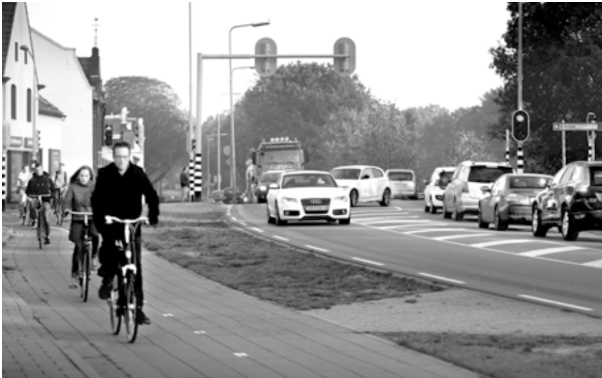
De projectgroep werkt aan een plan van aanpak voor de vervolgfase van de nieuwe wegverbinding A2-N266.