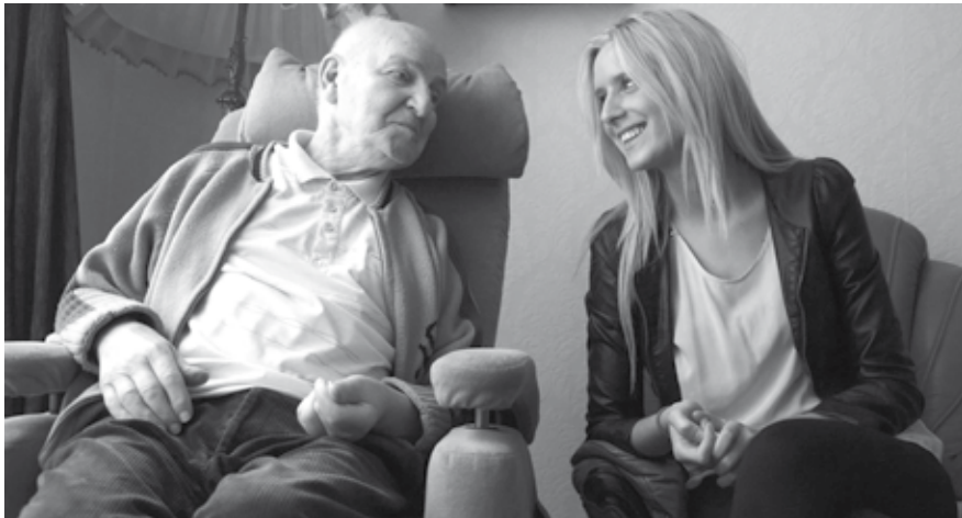
Mantelzorgers vervullen zonder dat ze het soms zelf in de gaten hebben een enorm belangrijke rol in onze maatschappij.