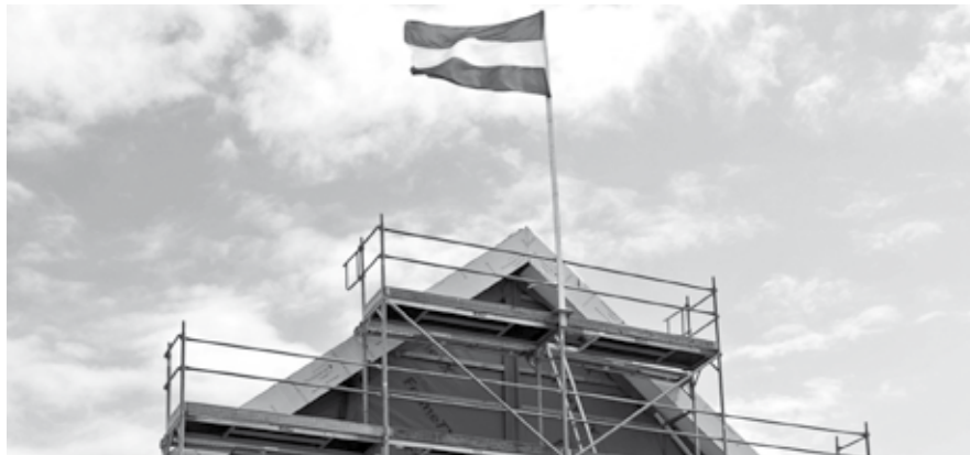
Een kavel kopen in onze gemeente biedt u veel flexibiliteit en maatwerk.