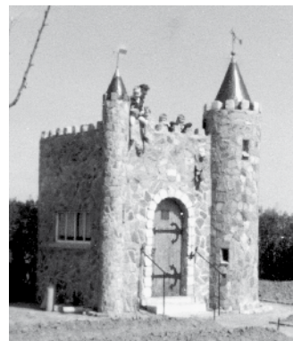
Het 'kasteel' in de tuin aan de Bredeweg. Honderden Nederweertenaars bewaren hier een jeugdherinnering aan.

Lange tijd was er nog een tweede folle-kasteel in Nederweert. Het stond in de diepe achtertuin van de familie Bruekers aan de Bredeweg 32. Het begaanbare miniatuurkasteel met twee verdiepingen, kantelen, torenspitsen en een wenteltrap was gebouwd uit natuurstenen restanten van oude gebouwen en kasseien van de voormalige keibestrating van de Kerkstraat. Er werd drie jaar aan ge-